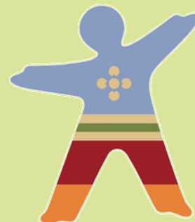
Abb. unten: Treffpunkt Alter Bahnhof Hützemert

Öffnungszeiten: samstags: 14 - 18:00 Uhr, sonntags: 12 - 18 Uhr, Anmeldung + Infos unter Tel.: 02763/212480 oder gruppe.stupperhof@josefshaus-olpe.de Veranstalter: Scheunenwirtschaft Op'm Stupper, Webseite: http://www.josefshaus-olpe.de/angebote-und-leistungen/intensivgruppen/stupperhof.html