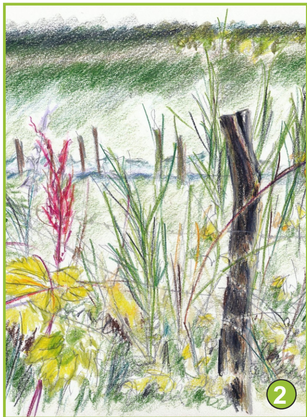
Zeichnungen: Helmut Clemens