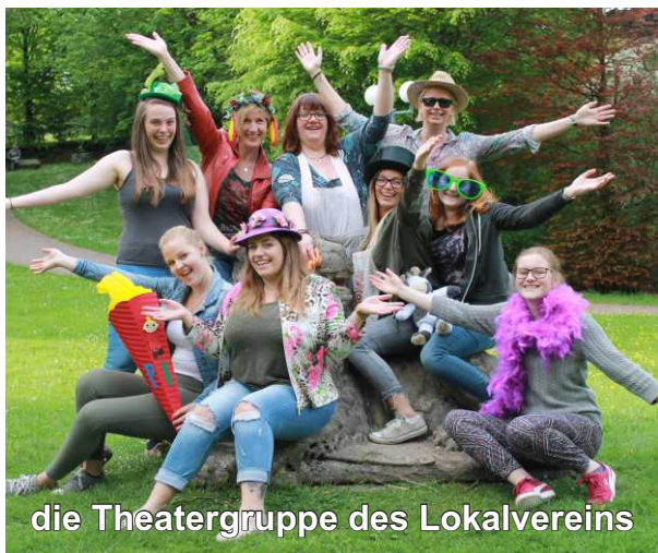
die Theatergruppe des Lokalvereins

... während des Konzertes: Prämierung der Erntewagen. Veranstalter: Landwirtschaft-licher Lokalverein Drolshagen e.V., E-Mail: kontakt@lokalverein-drolshagen.de, Website: www.lokalverein-drolshagen.de