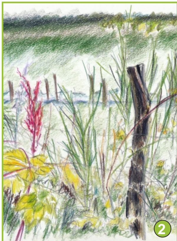
Zeichnungen: Helmut Clemens

Ein Wanderweg für alle, die gerne zeichnen oder zeichnen lernen möchten.