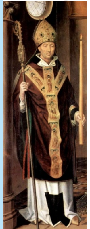
St. Blasius auf einem Altar von Hans Memling (1491) in Lübeck