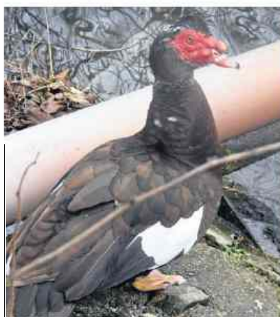
Auch eine Warzenente hat sich am Stadt-Teich niedergelassen.