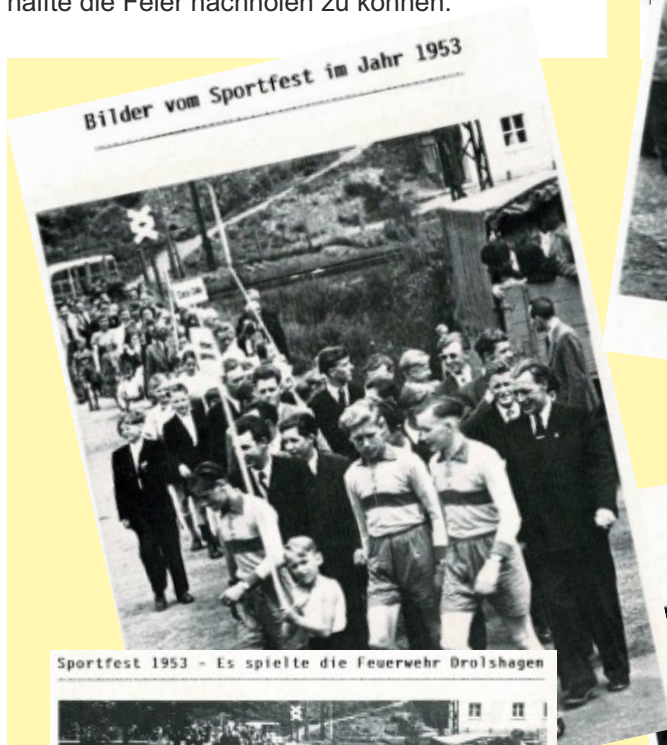
Sportfest 1953 – Es spielte die Feuerwehr Drolshagen