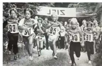
Stadt- und Waldlaufmeisterschaften Drolshagen 1983

Samstag, 27.09.2025, Drolshagen, in der Wünne